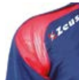
Inserti in mesh